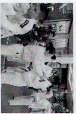
1º Encontro SESC de Judô