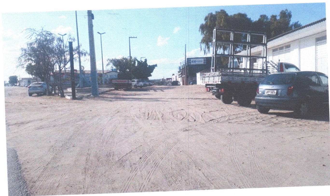
FOTO DA RUA EDIMILSON FERREIRA MATIAS , ACESSO AO BAIRRO NOÉ TRAJANO.

SALA DAS SESSÕES DA CÂMARA MUNICIPAL DE PATOS-PB. CASA JUVENAL LÚCIO DE SOUSA. Em, 17 de Outubro de 2022.