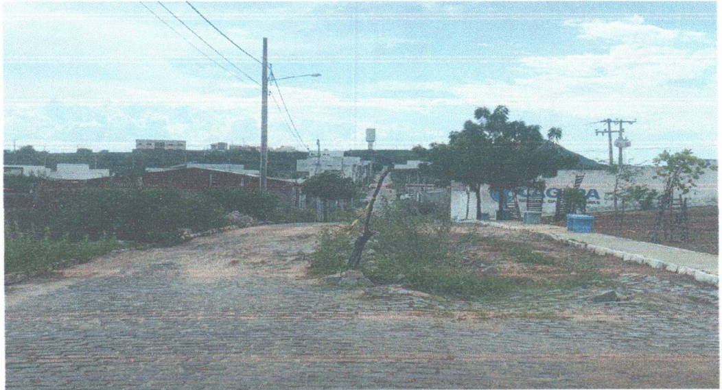
FOTO: DA RUA PADRE JERÔNIMO LEOPOLDINO

SOLICITO DO SENHOR SECRETÁRIO DE INFRAESTTUTURS, O CONCERTO DO CALÇAMENTO NA RUA PADRE JERÔNIMO LEOPOLDINO, AO LADO DA CAIXA D'AGUA , NO LOTEAMENTO CARMEN LÊDA